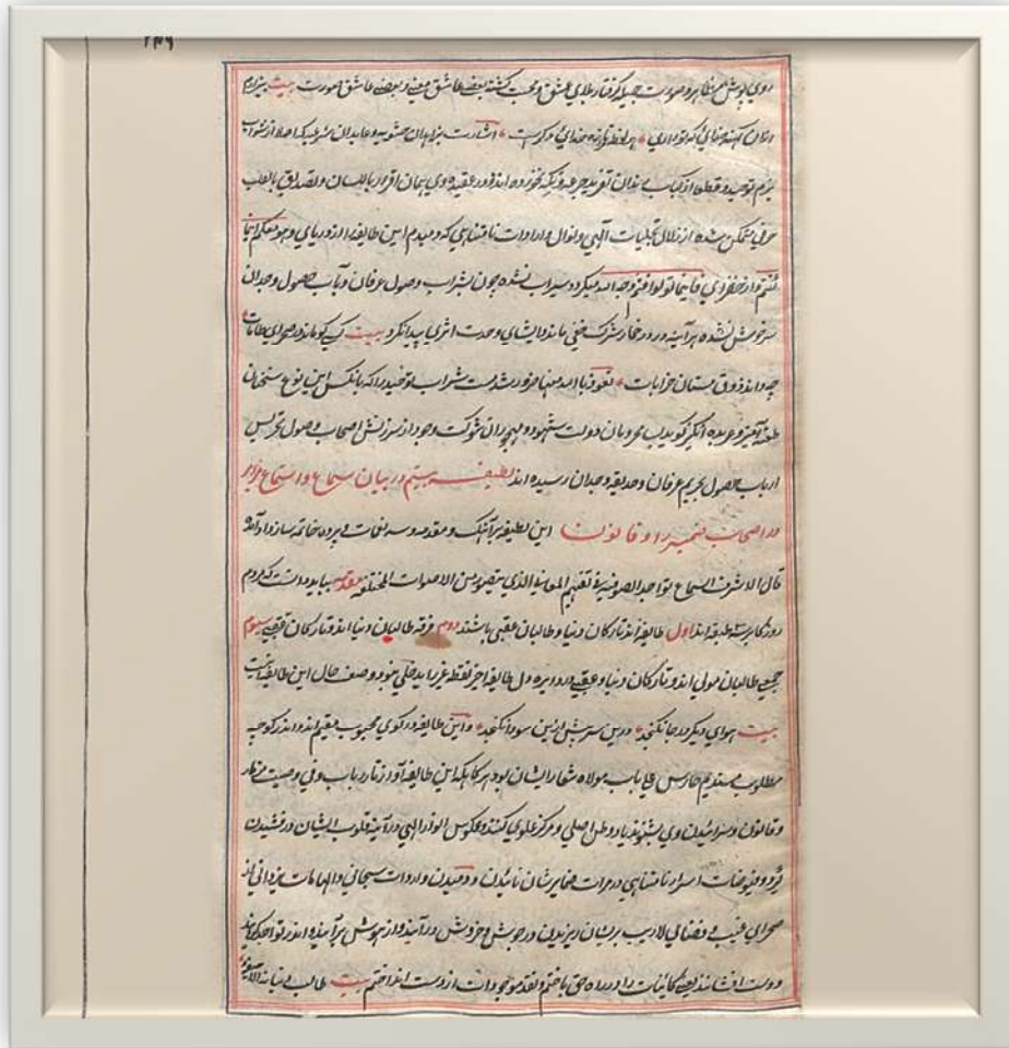
copy of Lataife Ashrafi, Manuscript Khuda Bakhsh Oriental Public Library, Patna